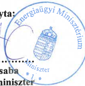
Lantos Csaba energiaügyi miniszter